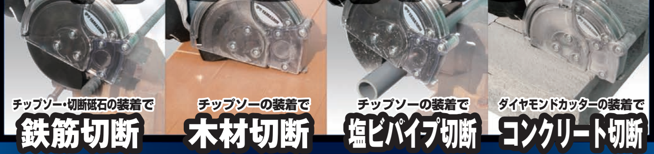
チップソー・切断砥石の装着で 鉄筋切断 チップソーの装着で 木材切断 チップソーの装着で 塩ビパイプ切断 ダイヤモンドカッターの装着で コンクリート切断